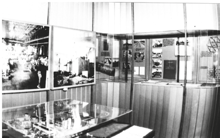
Время сохранило исторические фотографии фрагментов экспозиций разных лет