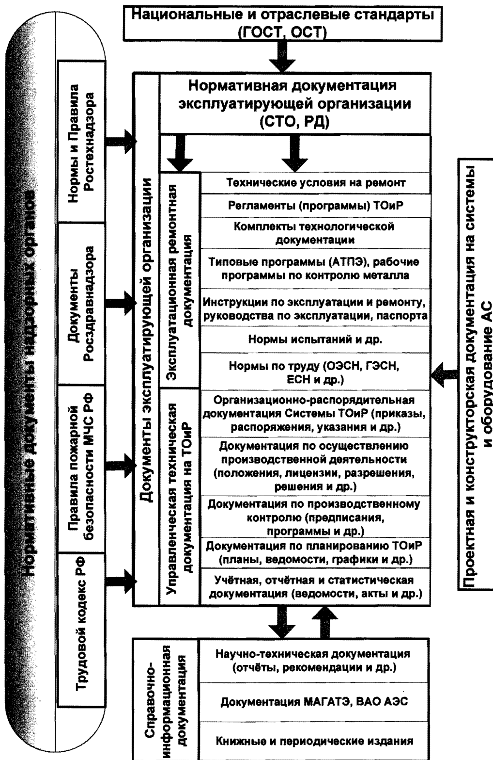
Рисунок 6.1 - Структура документации, составляющей информационное обеспечение ремонта систем и оборудования АС».